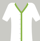
Agent de service hospitalier