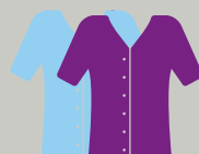
Personnel du bloc opératoire